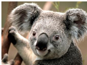
Figure 1.1. Le Koala

Pour ajouter une légende à une image, on utilise la commande \caption disponible dans l'environnement figure . Par exemple :